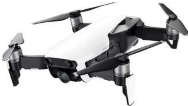
Figura 2. Aeronave Mavic Air DJI.

Las principales características del dron utilizado son: Peso de despegue: 430 g, Dimensiones: Plegado: 168×83×49 mm (Largo x Ancho x Alto), Extendido: 168×184×64 mm (Largo x Ancho x Alto), Distancia diagonal: 213 mm, Velocidad máxima en ascenso: 4 m/s (modo S), 2 m/s (modo P), 2 m/s (modo Wi-Fi). Velocidad máxima en descenso: 3 m/s (modo S), 1.5 m/s (modo P), 1 m/s (modo Wi-Fi).