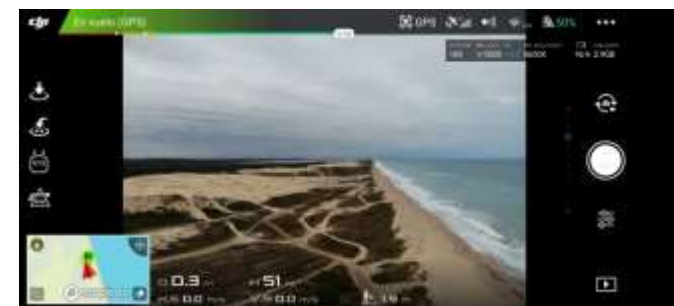
Figura 5. Imágenes aéreas de los diversos puntos de medición.