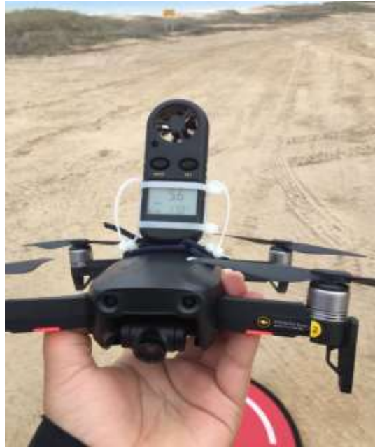
Figura 4. Montaje del sistema aéreo de medición del viento.

Para realizar las mediciones se hizo el montaje del anemómetro sobre el dron como se ilustra en la figura 4; mientras que en la figura 5 se ilustran un grupo de fotografías adquiridas con la cámara de video de la aeronave en los diversos puntos de medición.