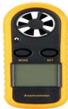
Figura 3 Anemómetro JG-055388

Las principales características del anemómetro utilizado son: velocidad del aire: Rango: 0 – 30 m / s, Resolución: 0,1 m / s, Umbral: 0,1 m / s, Precisión: +/- 5%. Temperatura del aire: Rango: -10°C – 45°C, Resolución: 0.2°C, Precisión: \pm 2 °C. Se alimenta con una batería de 3V CR2032. Humedad de funcionamiento: menor o igual al 90% de HR. Consumo de corriente: aproximadamente 3 mA. Tamaño de Elemento: 105 mm * 40 mm * 18 mm y Peso de 50 g.