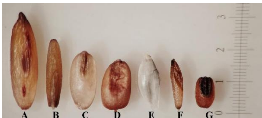
Figura 2. Cariópside vista en estereoscopio de: A) banderita, B) navajita azul, C) gigante, D) buffel, E) Klein, F) Liendrilla roja, G) zacate llorón, respectivamente. Pasto banderita es la especie que presenta mayor tamaño (3 mm).