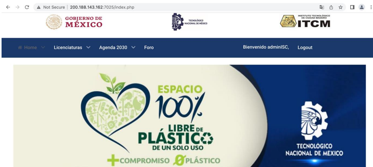
Figura. 4. Interfaz gráfica de un administrador de programa educativo