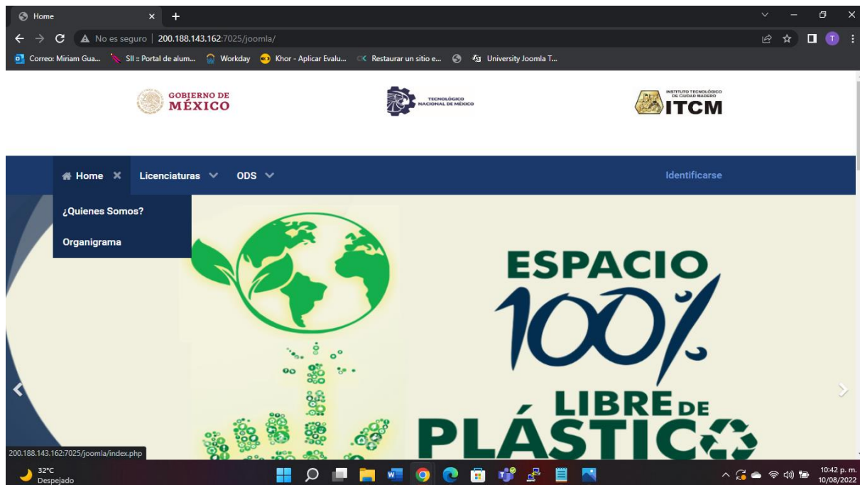
Figura 2. Interfaz de invitado

estudiantiles de investigación e innovación tecnológica que se encuentren relacionados con el tema de desarrollo sostenible, están disponibles para cualquier miembro de la sociedad.